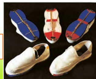
کِلاش ( گیوه ی کرمانشاهی)